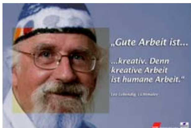
In der Ausstellung „Gute Arbeit ist...“, DGB 2008