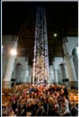
Den Haag 2009 NL