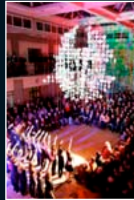
Dinslaken 2010 D