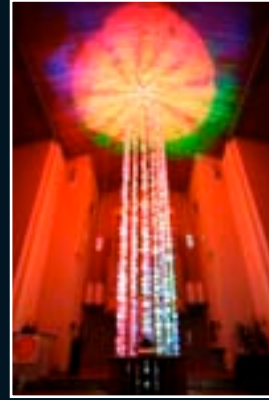
Dortmund 2008 D