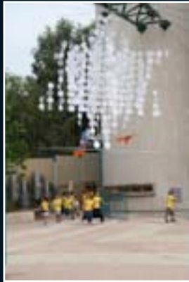
Netanya 2009 IL