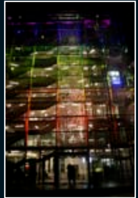
Essen 2010 D