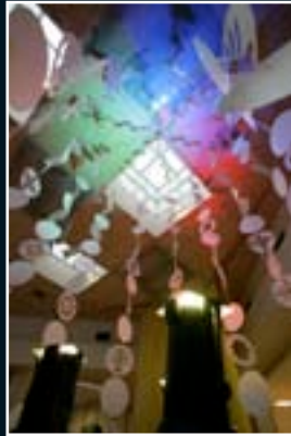
Utrecht 2009 NL