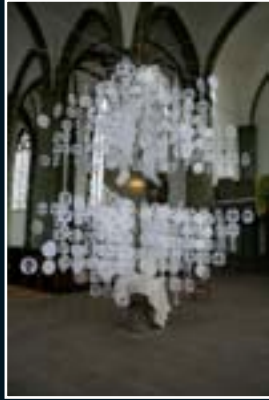
Hamm 2006 D