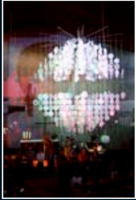
Hannover 2005 D