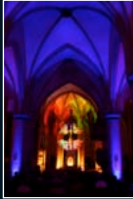
Unna 2006 D