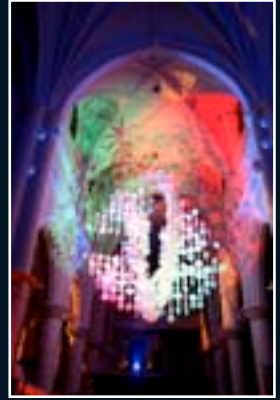
Thorn 2009 NL